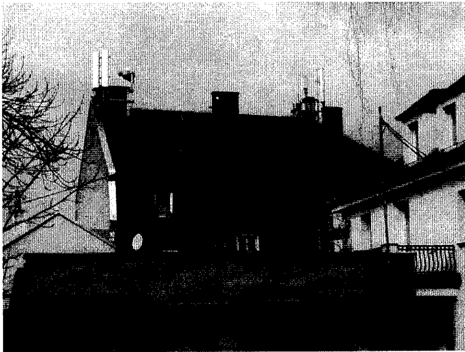
Zof. nr 1: Widok ogólny instalacji radiokomunikacyjnej.